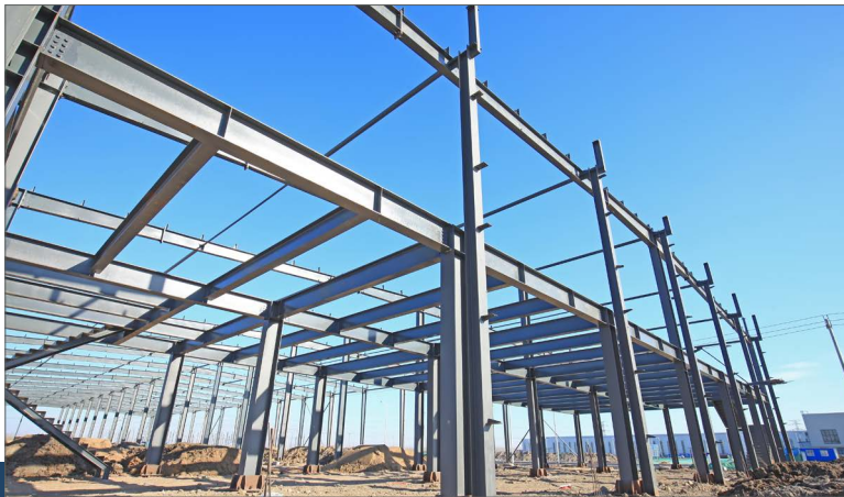
Stahlkonstruktion für Hallenbau

Wir konstruieren, legen alle Traglasten nach Ihren Wünschen aus und übernehmen dafür alle statischen Berechnungen. Selbstverständlich sorgen wir auch für den Transport und, da wir möglichst viele Elemente vormontieren, für eine schnelle und reibungslose Montage.