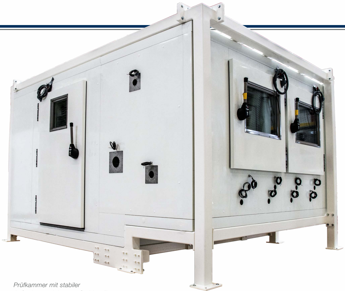
Prüfkammer mit stabiler Außenkonstruktion aus Stahlprofilen