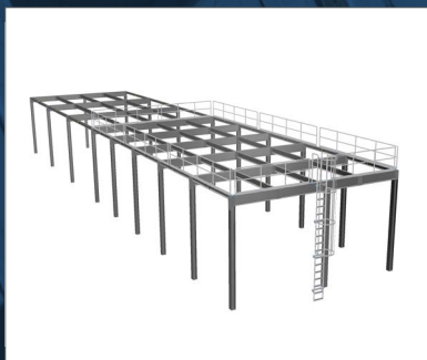
Maschinenbühne mit Geländer und Steigleiter. Die Tragepfosten sind nur an den Außenkanten der Grundfläche platziert, so dass der Platz unterhalb der Bühne ohne Hindernisse ausgenutzt werden kann.