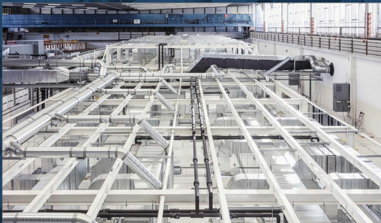
Außenkonstruktion für eine Reinraumanlage

→ Konstruktion → Statik → Fertigung → Montage